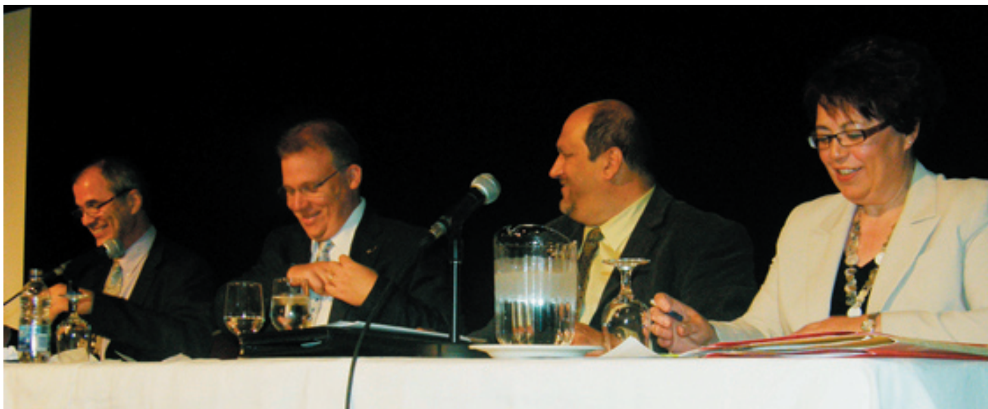
Petit moment de détente impromptu à la table des dirigeants de la Corporation.