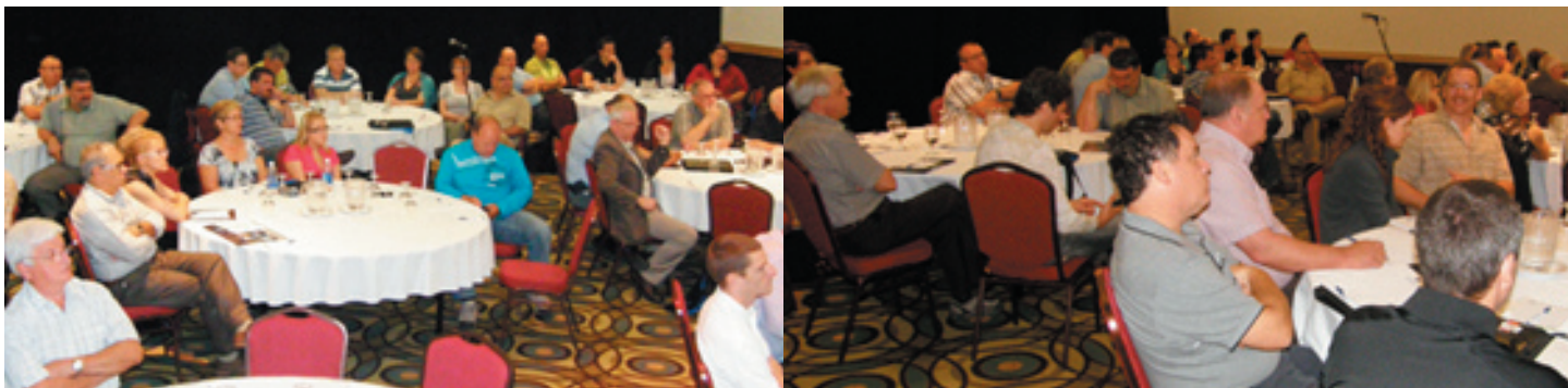
Une partie de l'assistance à l'Assemblée générale annuelle du 10 juin.